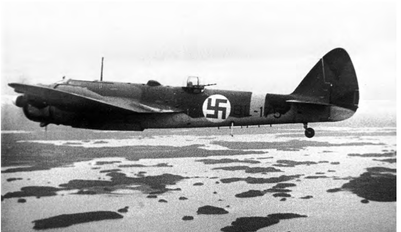
Raskaiden tappioiden jälkeen PLeLv 46 sai 12.6.44 vahvistukseksi 1/PLeLv 48:n kapteeni Olavi Siirilän viisi Blenheimiä kymmeneksi päiväksi. Tässä BL-175 palaa pommituslennolta Viipurinlahden yllä 22.6.44.